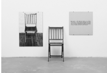
코수스, 「하나, 그리고 세 개의 의자」

쿠넬리스는 주변에서 흔히 볼 수 있는 살아 있는 말 12마리를 화랑 벽에 매어 놓고, 감상자가 화랑이라는 환경 안에 놓인 실제 말들의 존재와 말들의 온기와 냄새, 그리고 소리를 체험해서 다양하게 작품의 의미를 만들도록 하였다.